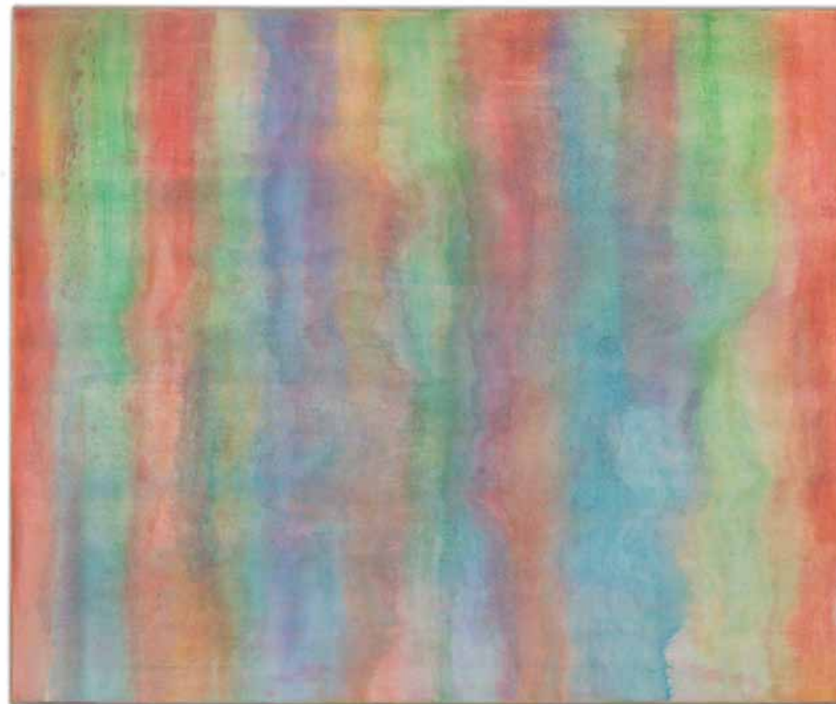
wave , 2013 127 x 152 cm óleo sobre linho