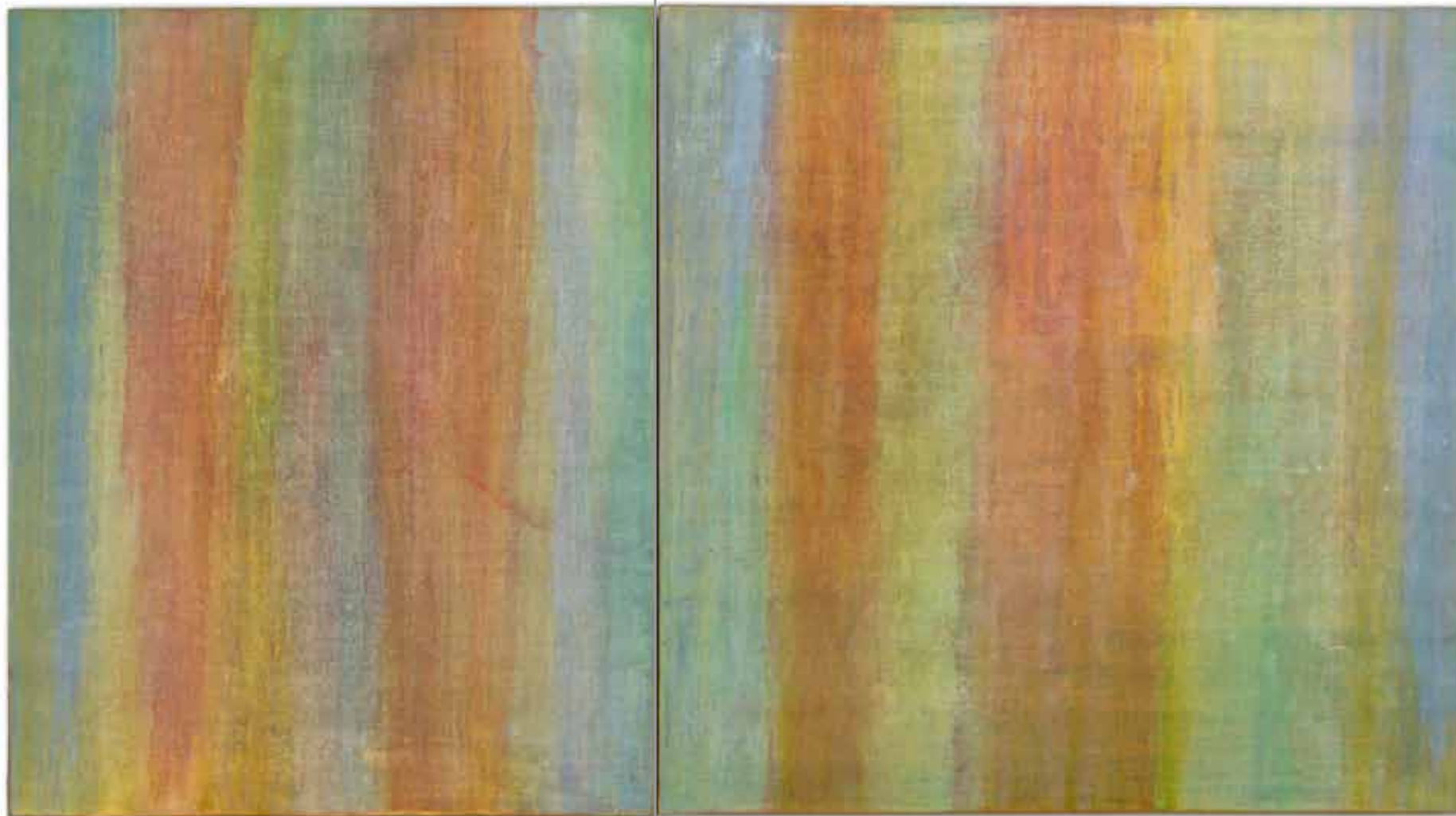
nativas [1 e 2], 2013 127 x 228 cm técnica mista sobre linho