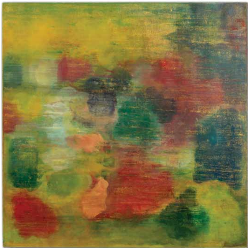
vento leste , 2013 152 x 152 cm técnica mista sobre linho