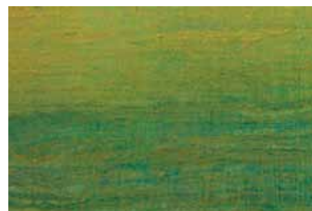
três rios 176 x 102 cm técnica mista sobre linho