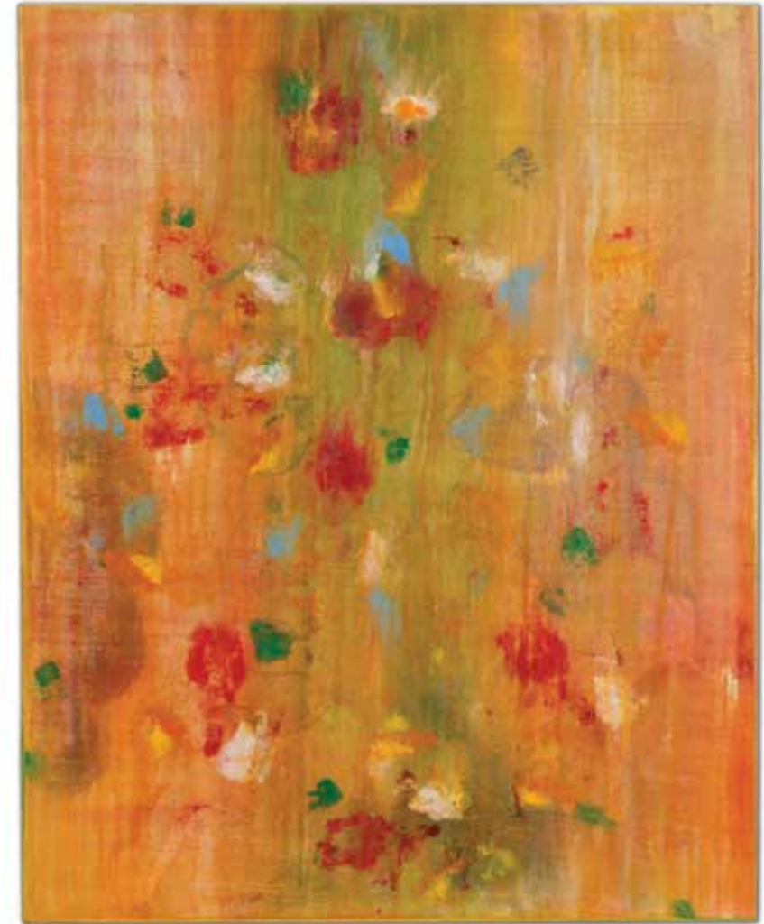
bloom , 2013 127 x 100 cm óleo sobre linho