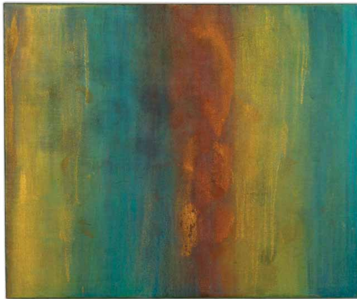
reflexo , 2013 107 x 129 cm técnica mista sobre linho