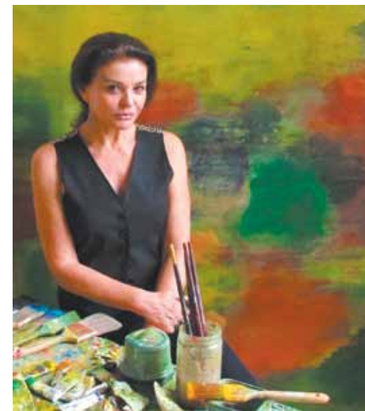
hurricane , 2013 153 x 203 cm técnica mista sobre linho