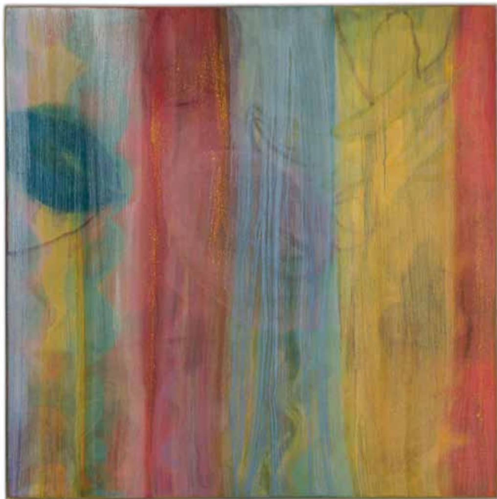
lingam , 2013 127 x 127 cm técnica mista sobre linho